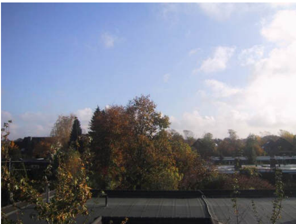
Blick über Hasloh