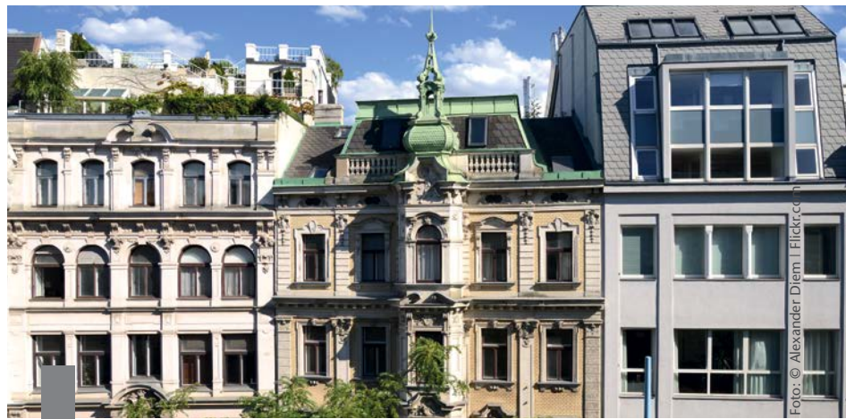
Das Jahr hat gut angefangen. Alles deutet auf eine weiterhin positive Entwicklung des Immobilienmarktes hin.

Nachdem das vergangene Jahr ein außergewöhnlich gutes Jahr für die Immobilienwirtschaft war, stellt sich die Frage, wie es weitergeht. Setzt sich der Preisschub kontinuierlich fort oder wird er schwächer? Ist gar eine Preisblase zu befürchten? Der Immobilienverband Deutschland IVD empfiehlt Eigentümern einer Stadtwohnung als Kapitalanlage, einen Verkauf zu prüfen. Der optimale Zeitpunkt sei jetzt. Der deutliche Nachfrageüberhang in den Top-Städten ermögliche es, die Wertsteigerungen der letzten Jahre zu realisieren. Von einer Überhitzung des Marktes gehen Fachleute nicht aus. Die aktuelle Analyse der Hauspreiszyklen der OECD-Länder zeigt, dass der Preisanstieg in Deutschland im Vergleich mit vergangenen Anstiegen moderat ausfällt. DB-Research erwartet, dass sich der Anstieg der Immobilienpreise in Deutschland fortsetzt, hält aber die Bildung einer Blase für unwahrscheinlich. Die dynamische Entwicklung ist auch eine Folge der niedrigen Zinssätze. Darlehensnehmer können sich jetzt die niedrigen Zinsen durch längere Laufzeiten sichern und den Spielraum für eine höhere Tilgung nutzen. Das ist vernünftig. Vorsicht ist aber bei Anbietern geboten, die für Vollfinanzierungen ohne Eigenkapital werben. Die grundsätzlich konservative Haltung der hiesigen Finanzierungsinstitute hat Deutschland vor einer Immobilienkrise wie einst in den USA oder England bewahrt.