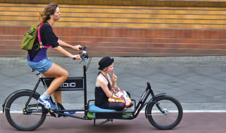
Das Fahrrad ist ein praktisches und umweltfreundliches Fortbewegungsmittel.

Die Stadt Münster führt auch diesmal den ADFC-Fahrradklima-Test bei den Städten über 200.000 Einwohnern an. Der Test fand 2012 zum fünften Mal statt und wurde unterstützt vom Bundesministerium für Verkehr, Bau und Stadtentwicklung. Rund 80.000 Radfahrer machten mit – beim letzten Fahrradklima-Test 2005 waren es nur 26.000. Andere Städte haben seitdem aufgeholt: Freiburg, im letzten Fahrradklima-Test nicht in der Wertung, steigt bei den Städten über 200.000 Einwohner direkt auf Platz zwei. Bei den Städten in der Kategorie 100.000 bis 200.000 Einwohner konnte Erlangen seinen Titel verteidigen, gefolgt von Oldenburg und Hamm. Bei den Großstädten über 200.000 Einwohnern gehört Karlsruhe, das „Fahrradstadt Nummer eins in Süddeutschland“ werden will, zu den heimlichen Gewinnern – stärker hat sich keine andere Stadt dieser Größe verbessern können. Das gilt auch für Potsdam bei den Städten mittlerer Einwohnerzahl und für Wernigerode in der Kategorie der Städte bis 100.000 Einwohner.