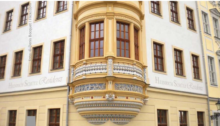
Altersgerechtes Wohnen bezieht sich nicht nur auf die Wohnung, die den Bedürfnissen älterer Menschen angepasst ist, sondern auch auf das gesamte Umfeld.

Schon jetzt und künftig verstärkt fehlen vielerorts altersgerechte Wohnungen. Das ist das Ergebnis einer Analyse des Bundesinstituts für Bau-, Stadt- und Raumforschung (BBSR). Die Anforderungen an die Wohnungsversorgung gehen dabei über die Bereitstellung alterstauglicher Wohnungen hinaus. Gefragt sind auch ein barrierefreies Wohnumfeld, eine wohnortnahe Infrastruktur und soziale Angebote im Stadtteil. Bei der Planung können auch andere Zielgruppen als Senioren berücksichtigt werden. Denn das Interesse an Projekten, in denen gemeinschaftliche Wohnformen realisiert werden können, rückt immer mehr in den Vordergrund. Dabei sind auch Konzepte für selbst nutzende Eigentümer gefragt. In vielen Städten gibt es inzwischen Gemeinschaftsprojekte, die auch darüber beraten, auf welche Weise Senioren sich in die altersgerechte Entwicklung ihres Stadtquartiers einbringen können.