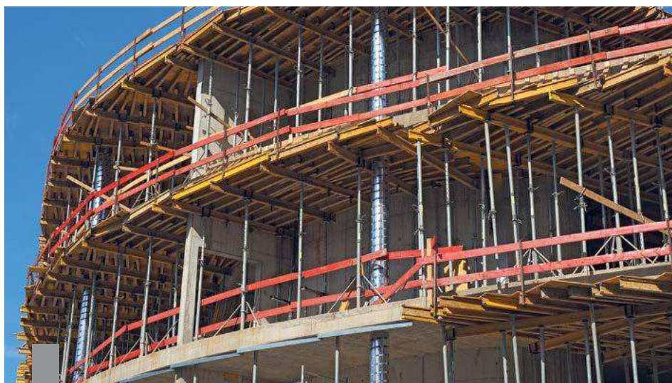
In Deutschland werden viel zu wenige Wohnungen gebaut, vor allem in den Großstädten, in Köln und Düsseldorf sind die Baugenehmigungen sogar rückläufig.

Mehr als die Hälfte des Wohnungsbaubedarfs entfällt auf die Großstädte. Der Unterschied zwischen Bedarf und Bautätigkeit ist nirgendwo größer als in Berlin. In den kommenden Jahren müssen dort rund 31.000 Wohnungen pro Jahr gebaut werden, wenn jährlich 500.000 weitere Flüchtlinge nach Deutschland einwandern. Gebaut wird aber nicht einmal ein Drittel. München brauchte rund 17.000 neue Wohnungen jährlich, Hamburg gut 15.000 und Köln 8.000. Insgesamt müssen nach Berechnungen des Instituts der deutschen Wirtschaft Köln in Deutschland bis 2020 rund 380.000 Wohnungen pro Jahr gebaut werden – 2015 waren es aber nur 247.000. Selbst wenn die Zuwanderung ab 2017 abrupt enden würde, reicht die Bautätigkeit nicht aus. Auch dann müssten insgesamt rund 310.000 Wohnungen pro Jahr entstehen, um den Zuzug von Studenten, Rentnern und Erwerbstätigen in die Großstädte zu meistern.