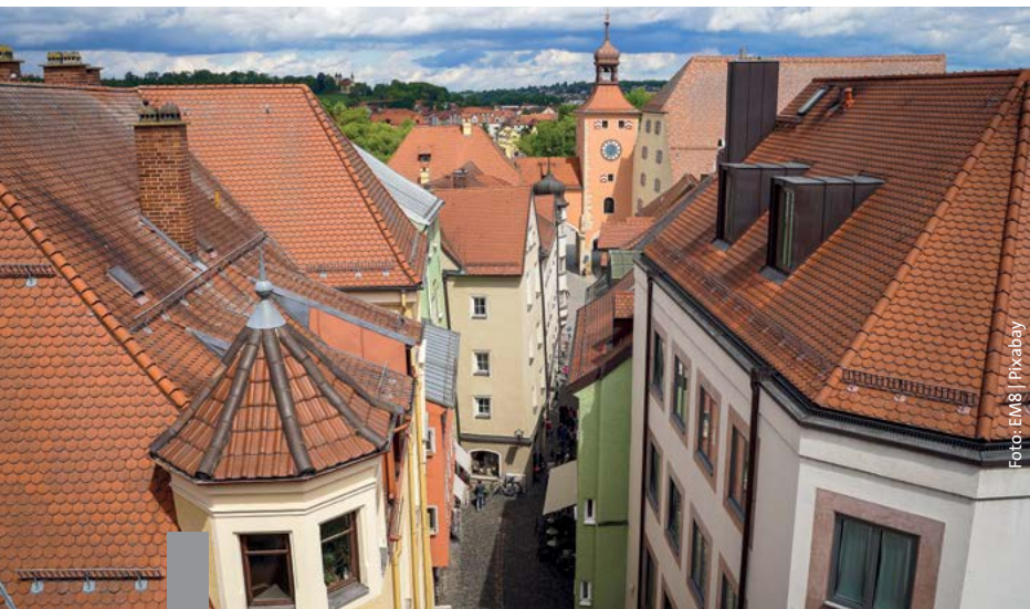
Unter den Dächern der Städte schlummern noch große Wohnraumreserven.

Der Bundestagsausschuss für Bau, Wohnen und Stadtentwicklung hat in einer Anhörung verschiedene Experten zum Thema Dachausbau befragt. Dieser wird als Chance gesehen, in Städten zusätzlichen Wohnraum zu schaffen. Dazu sind Änderungen des Baurechts in der Diskussion – von einer Genehmigungsbefreiung für einfache Aufstockungen bis hin zur Zulässigkeit einer Überschreitung der erlaubten Geschossflächenzahl ohne Ausgleichsmaßnahmen. Denkbar ist auch eine Befreiung von der Pflicht, Stellplätze zu schaffen. Auch umfangreiche neue Förderprogramme durch die KfW wurden ins Gespräch gebracht.