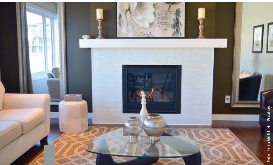
Ein warmer Sommer garantiert keine niedrigen Heizkosten im Winter.

Der Wärmemonitor 2018 des Deutschen Instituts für Wirtschaftsforschung zeigt: Die deutschen Privathaushalte haben 2018 im Durchschnitt zwei Prozent mehr Heizenergie verbraucht. Seit 2015 ist der Heizenergiebedarf um sechs Prozent pro Quadratmeter gestiegen. Teuer wurde dies für Häuser mit Ölheizung: 2018 stieg der Heizölpreis um neun Prozent, während der Gaspreis im Schnitt um vier Prozent sank. Rund die Hälfte der Mehrfamilienhäuser wird mit Gas beheizt, ein Viertel mit Öl. Der Wärmemonitor zeigt auch die Sanierungsquote: Zwischen 1992 und 2000 schwankte der Anteil der pro Jahr neu gedämmten Häuser im Osten Deutschlands zwischen ein und vier Prozent. Im Westen stieg er seit 1992 von 0,3 Prozent auf knapp ein Prozent; seit 2016 fällt er wieder. Energetische Sanierungen senken den Wärmebedarf.