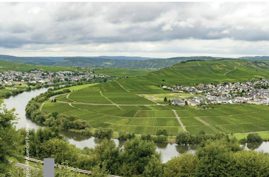
Deutschland ist von einem zusammenhängenden und dichten Netz aus Gebäuden bedeckt. Wenn es um nachhaltige Entwicklung und Klimaschutz geht, ist das Thema Flächennutzung von zentraler Bedeutung.

Wer in Deutschland im Wald steht, der hält sich nur vermeintlich in abgelegener Natur auf. Egal an welchem Ort man sich befindet, das nächstgelegene Haus ist nicht weiter als 6,3 Kilometer entfernt. Für 99 Prozent des Gebäudebestandes gilt sogar: Das nächste Haus befindet sich in maximal 1,5 Kilometer Abstand. Dieses Ergebnis hat die Wissenschaftler des Leibniz-Instituts für ökologische Raumentwicklung (IÖR) überrascht. Sie wollten untersuchen, bis zu welchem Grad Deutschland überbaut ist und ob es hierzulande überhaupt noch gebäudefreie Zonen gibt. Ob Wohnhäuser, Fabrikgebäude oder Garagenhof – alle Gebäude in Deutschland mit einer Grundfläche über zehn Quadratmeter wurden bei den Berechnungen berücksichtigt. Das größte gebäudefreie Gebiet misst gerade einmal 12,6 Kilometer im Durchmesser.