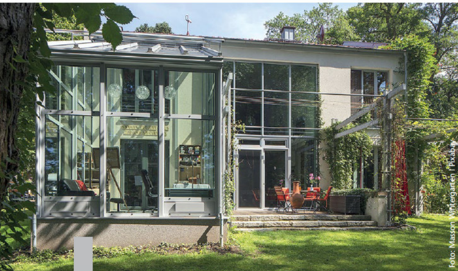
Ein Raum unter Glas bietet in der kühleren Jahreszeit jede Menge Spielraum.

Ein Wintergarten ist ein Gewinn an Lebensqualität – aber längst kein Luxus mehr. Er bietet mehr Lebensraum und ist ein Beitrag zum Energiesparen. Nach Norden ausgerichtet bietet er ganztags mildes Licht, nach Osten lässt er die Morgensonne auf den Frühstückstisch scheinen, im Westen verlängert er sonige Abendstunden. Die meisten Eigentümer wählen jedoch – wenn irgend möglich – die Südseite. Dort wirkt der Wintergarten als Wärmepuffer im Sommer und als zusätzliche Isolierung gegen Kälte im Winter. In Wohnwintergärten kann eine elektronische Klimasteuerung für Wohlfühlklima sorgen. Die Anlage regelt die Luftfeuchtigkeit und die Temperatur, steuert die Heizung und die Lüftung. Moderne Mehrfachverglasung minimiert den Energieverlust. Zusätzlich gibt es Glas, das vor Lärm oder UV-Strahlen schützt, das sich selbst reinigt oder bruchfest ist. Ganzjährig bewohnbare Wintergärten sind ab etwa 15.000 Euro zu haben, individuelle Konstruktionen können ein Vielfaches kosten.