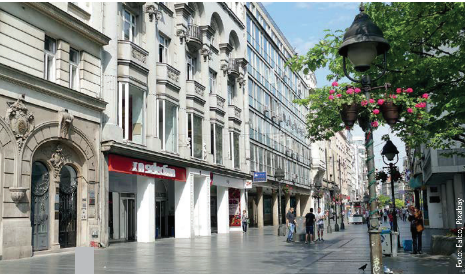
Bereits vor Corona herrschte in vielen Städten das Bewusstsein, dass eine Transformation der Innenstädte nötig sein würde.

Der Veränderungsprozess der Innenstädte hat schon vor einigen Jahren eingesetzt. In der Coronapandemie wird er deutlicher sichtbar: Die Verteilung des öffentlichen Raums in den Städten entspricht nicht mehr den Anforderungen an eine klimagerechte Stadt. Die innerstädtische Mobilität ist zu sehr am Leitbild des motorisierten Individualverkehrs ausgerichtet. Gewerbliche Nutzungen haben zu einem eintönigen Stadtbild geführt. Der Einzelhandel ist zu sehr durch Filialisten geprägt, die Gastronomie durch immer ähnlichere Imbissläden. Die Fußgängerzonen der 70er- und 80er-Jahre prägen wichtige Teile des Stadtbildes und wirken abends wie ausgestorben. Eine Aufwertung der Aufenthaltsqualität ist überfällig. Die Funktionalität der Innenstädte ist ein öffentliches Gut. Alternative Nutzungen spielen eine zentrale Rolle, um Innenstädte belebt zu halten. Die Umnutzung von Büroflächen könnte eine adäquate Möglichkeit sein, um bezahlbaren Wohnraum zu schaffen. Erdgeschosslagen eignen sich für kulturelle und soziale Nutzungen oder für neue Formen der urbanen Produktion. Die Stadt der Zukunft ist auf jeden Fall multifunktional.