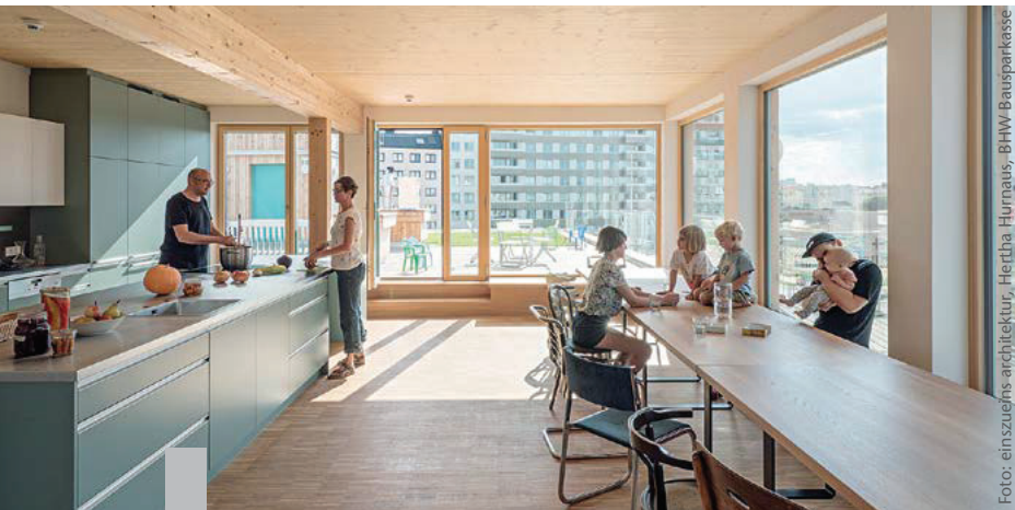
Neue Wohnkonzepte berücksichtigen das Bedürfnis nach Gemeinschaft und nach Individualität durch eine andere Organisation der Räume.