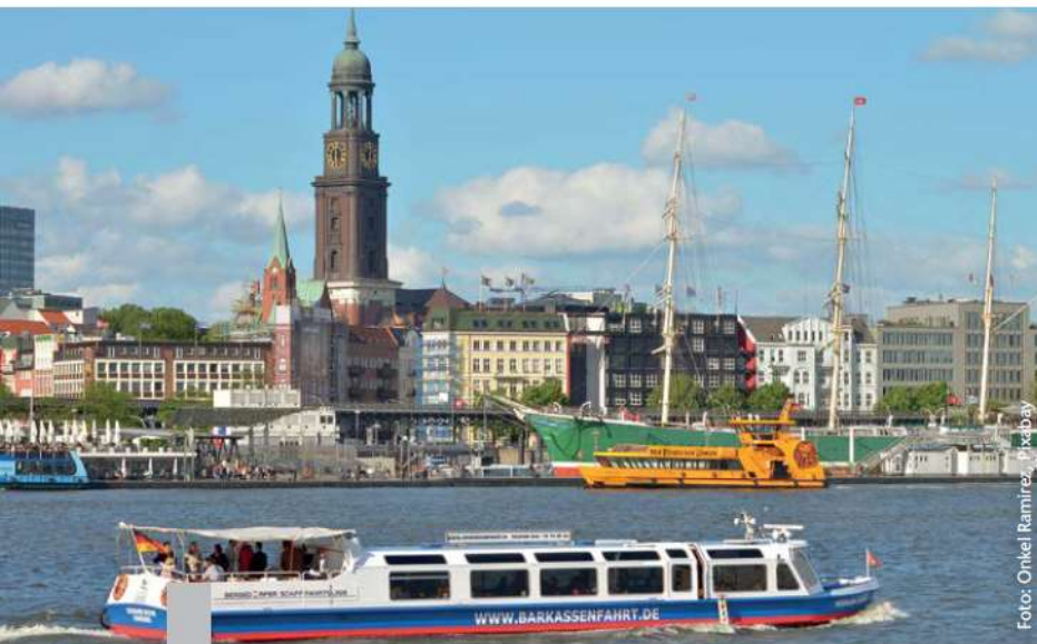
Hamburg steht für Weltoffenheit, München für Geselligkeit und Berlin für Kreativität. Sind das Klischees, oder ist etwas dran an diesen Vorstellungen?